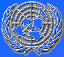
Tableau de Contenu