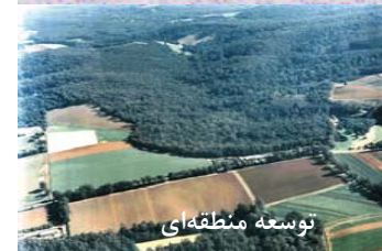
توسعه منطقه ای