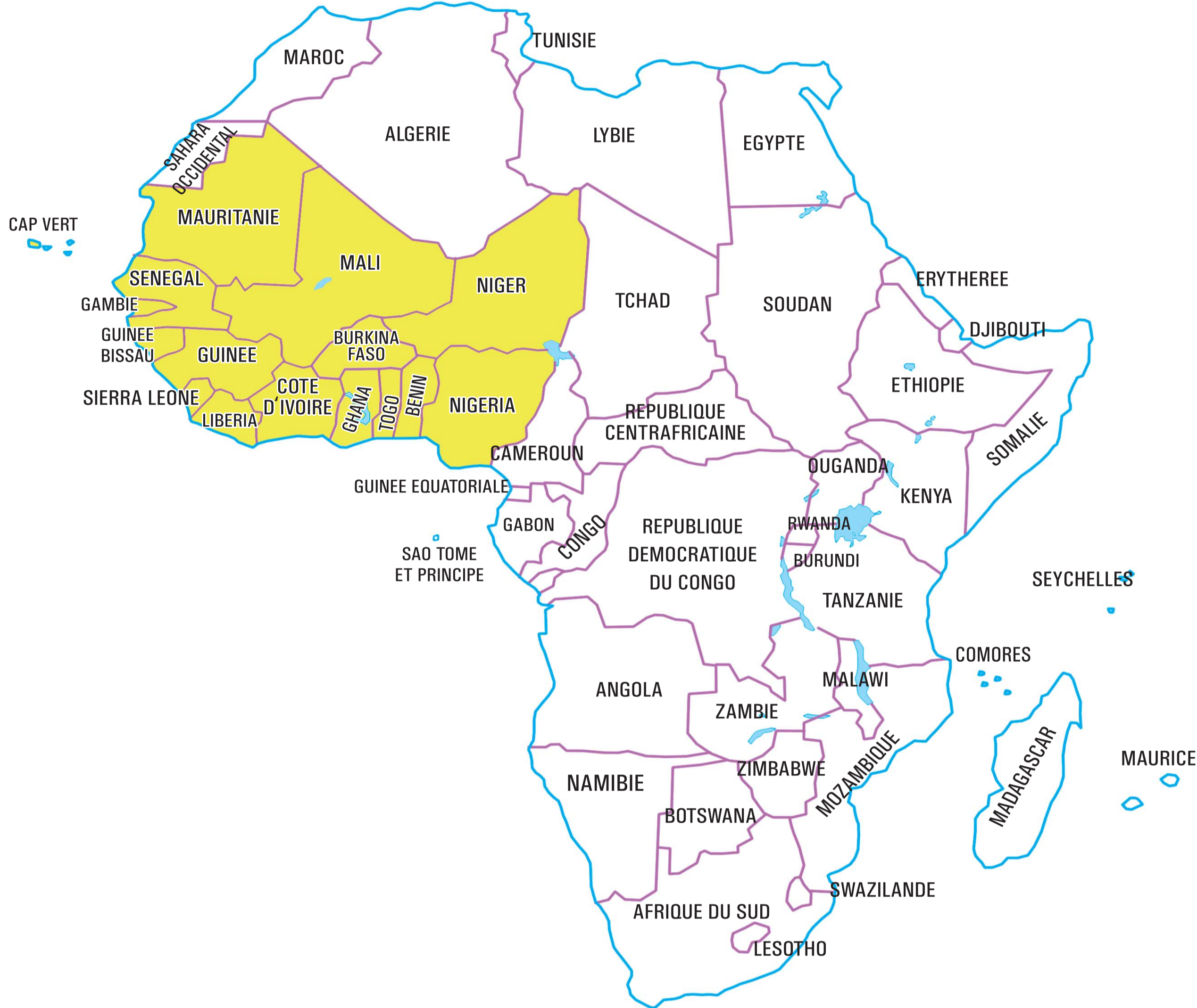
Africa West Division