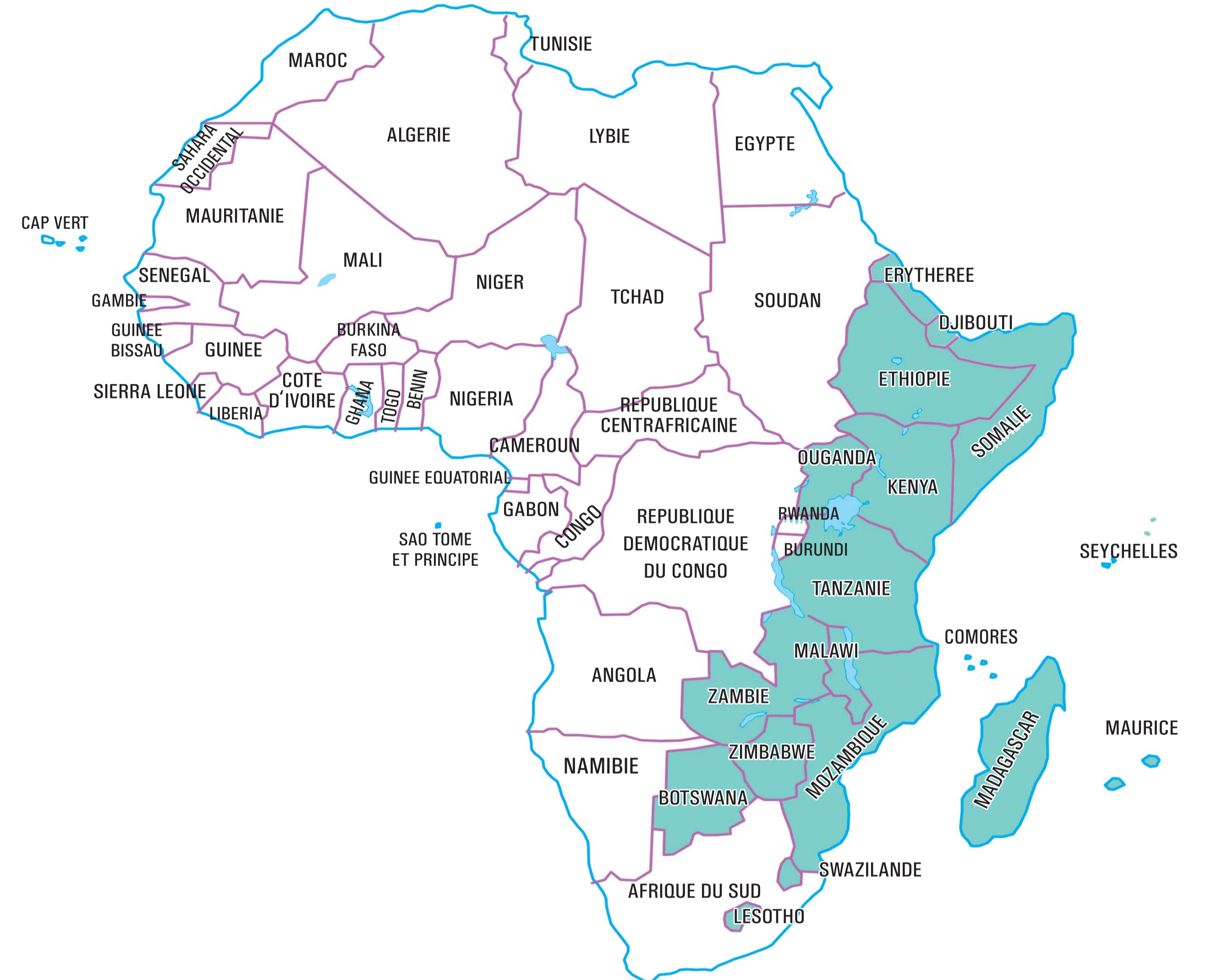
Africa East Division