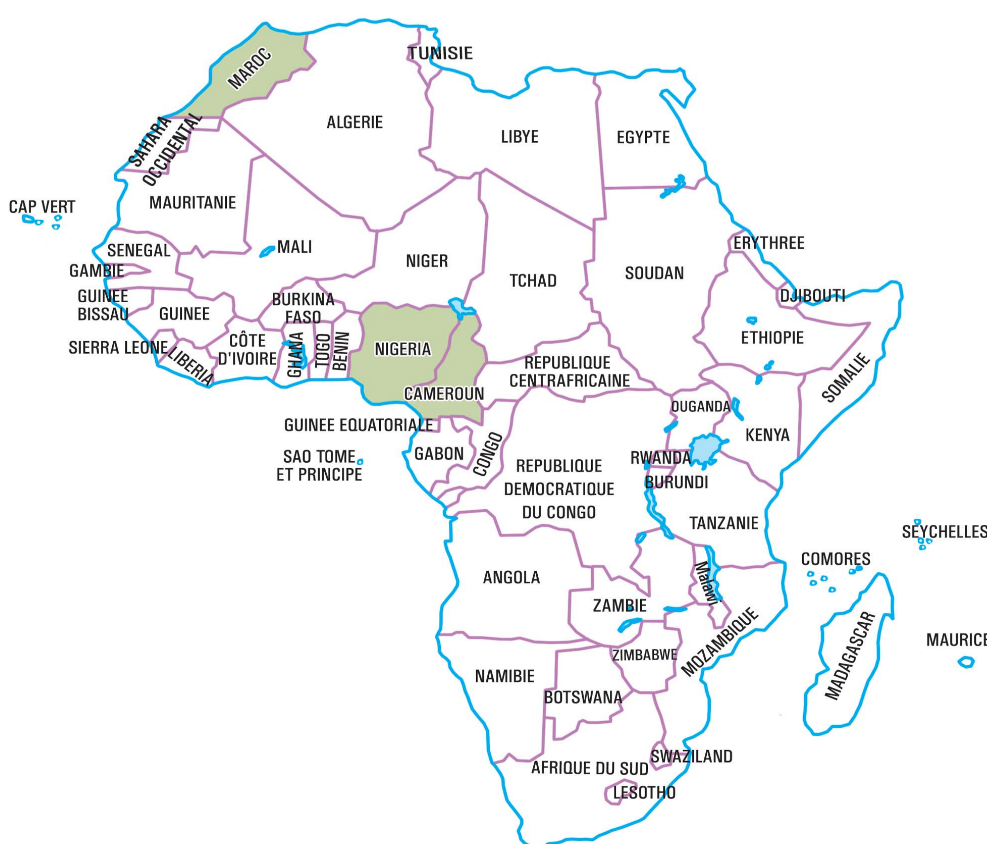
PAYS AYANT PARTICIPE 05 FOIS