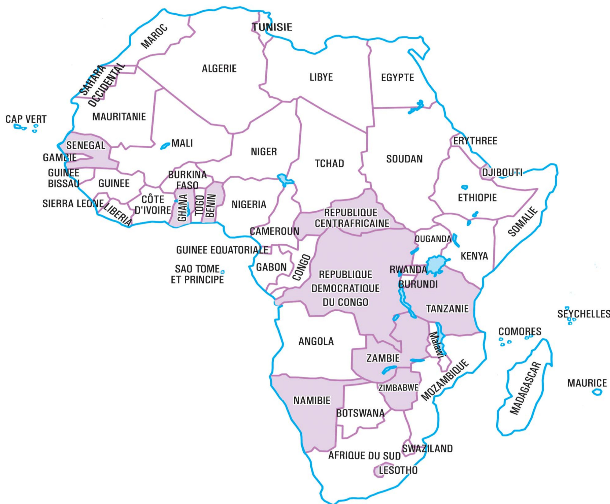
PAYS AYANT PARTICIPE 01 FOIS