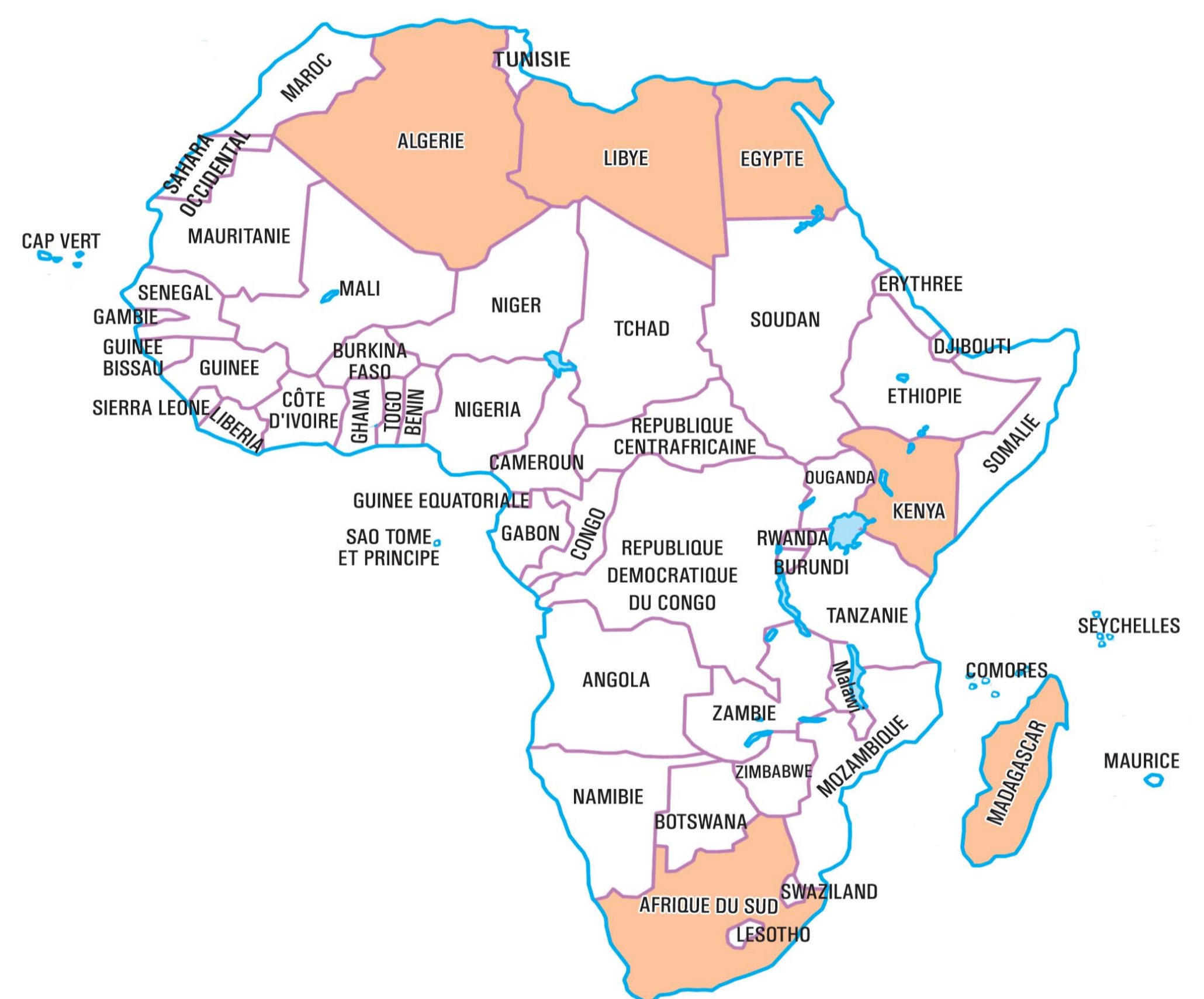
PAYS AYANT PARTICIPE 04 FOIS