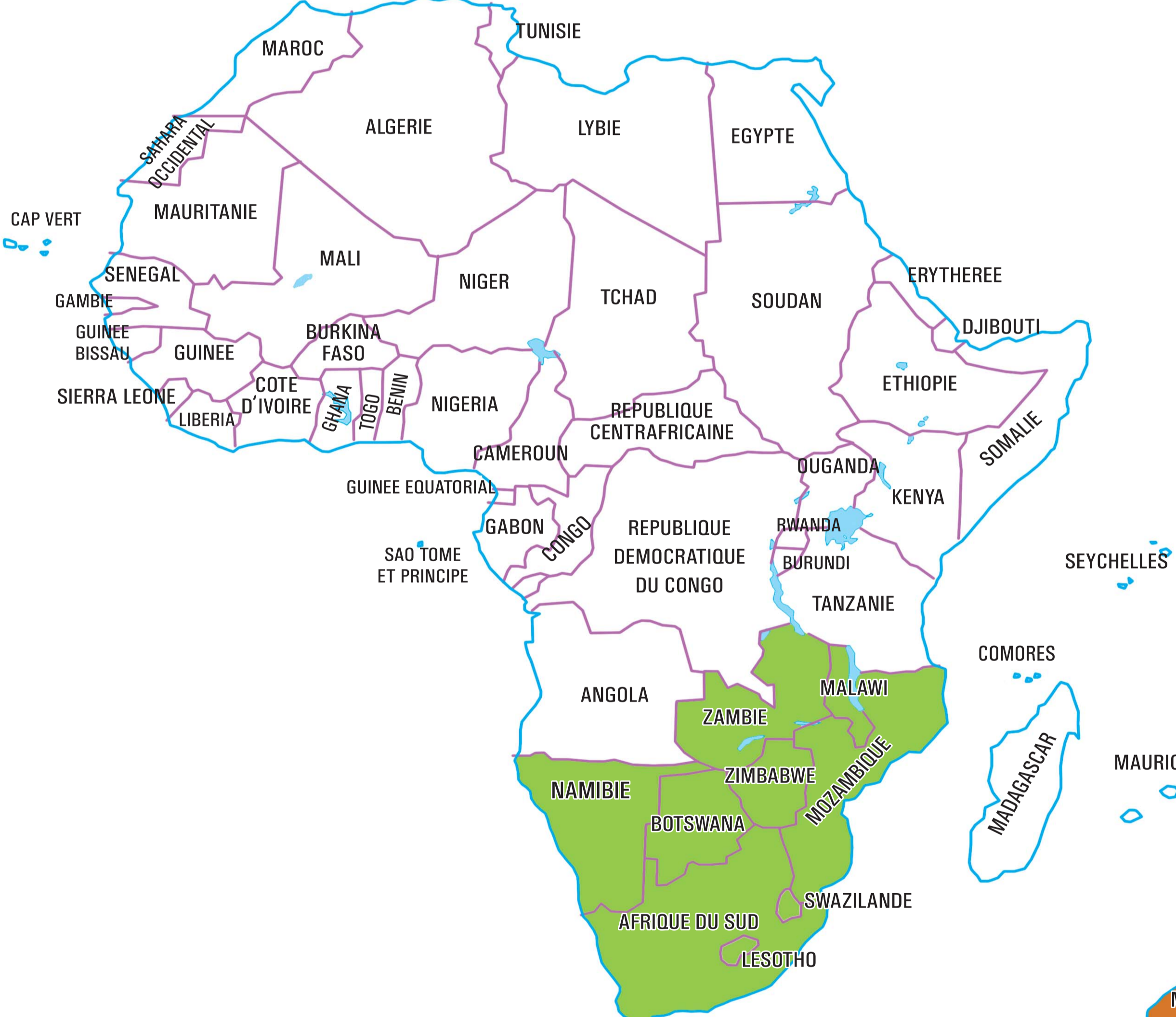
Africa South Division