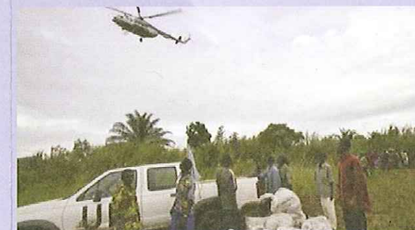
Systèmes de communication

À l'heure actuelle, des millions d'utilisateurs du World Wide Web ont besoin de noms géographiques de votre pays. Le Groupe d'experts des Nations Unies pour les noms géographiques peut-il aider les responsables à faire en sorte que ces données capitales soient disponibles et précises ?