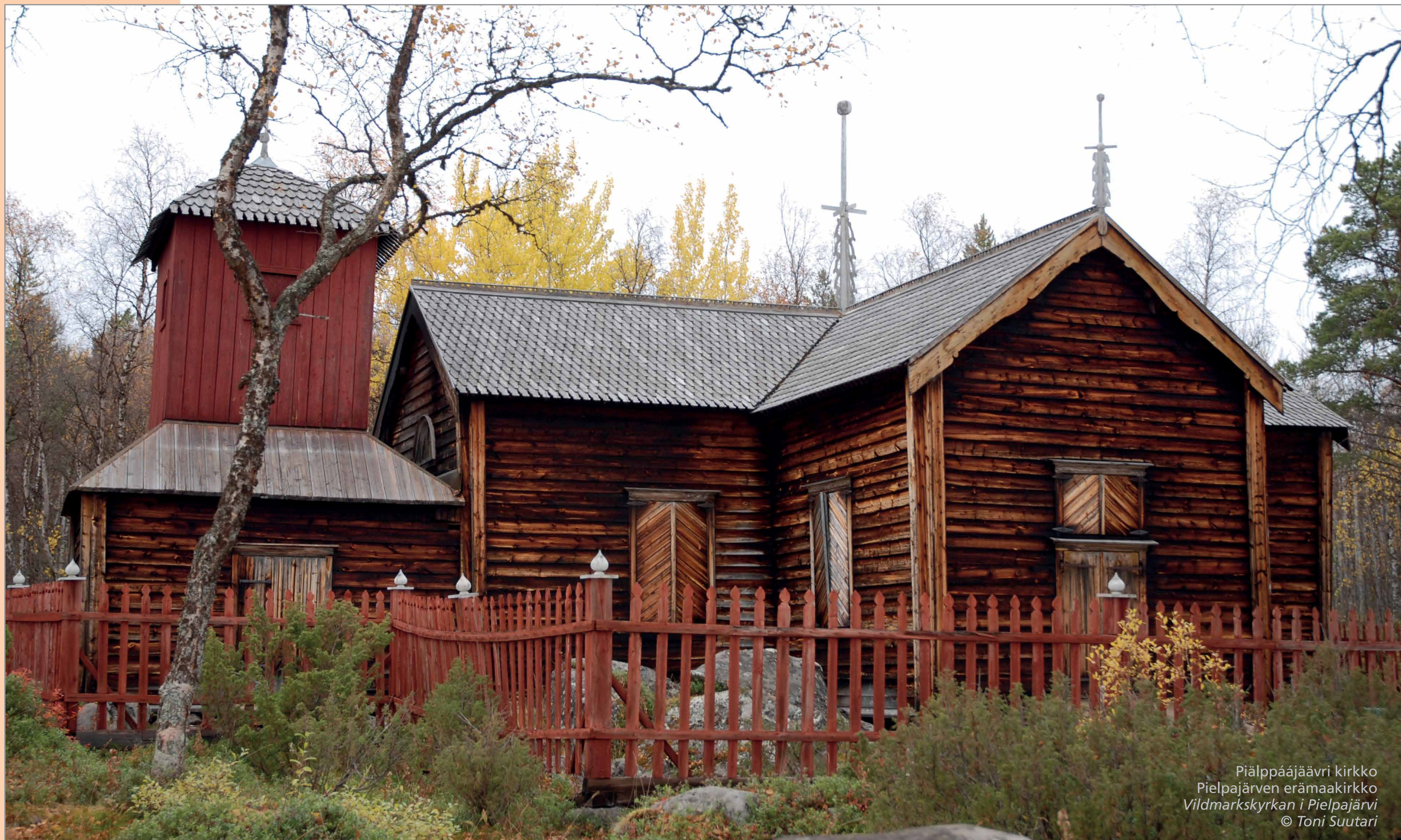
Piälppääjärvi kirkko Pielpajärven erämaakirkko Vildmarkskyrkan i Pielpajärv

Saamelaisalueen suomenkieliset paikannimet ovat usein mukaelmia tai käännöksiä saamelaiskielistä. Pielpajärven erämaakirkko sijaitsee Ison Pielpajärven rannalla Inarin kirkonkylän itäpuolella. Suomenkielinen Pielpajärvi on mukaelma inarinsaamenkielisestä nimestä Piälppääjärvi. Nimen alkuosa piälppää merkitsee pientä teräväkärkistä puunuolta ja loppuosa järvi järveä. Alueella on myös muita Pielpa-alkuisia nimiä: Pieni Pielpajärvi (Uccâ Piälppääjärvi), Pielpavuono (Piälppäävuonâ) ja Pielpaniemi (Piälppäänjargâ).