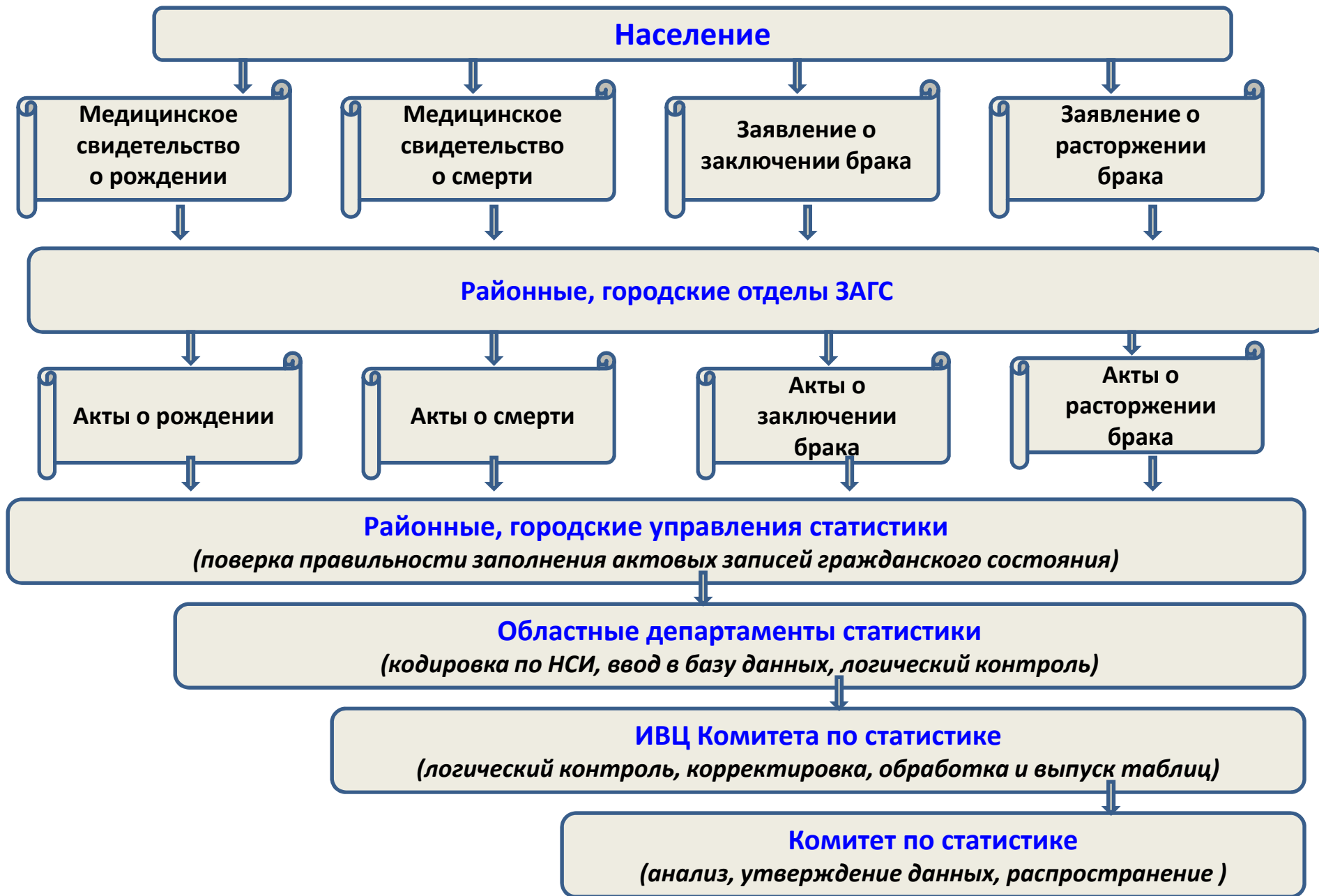
СХЕМА СБОРА ДАННЫХ О ЕСТЕСТВЕННОМ ДВИЖЕНИИ НАСЕЛЕНИЯ