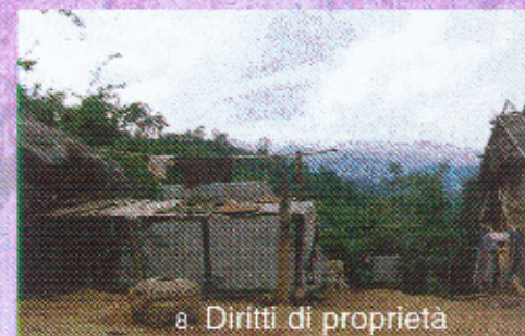
8. Diritti di proprietà