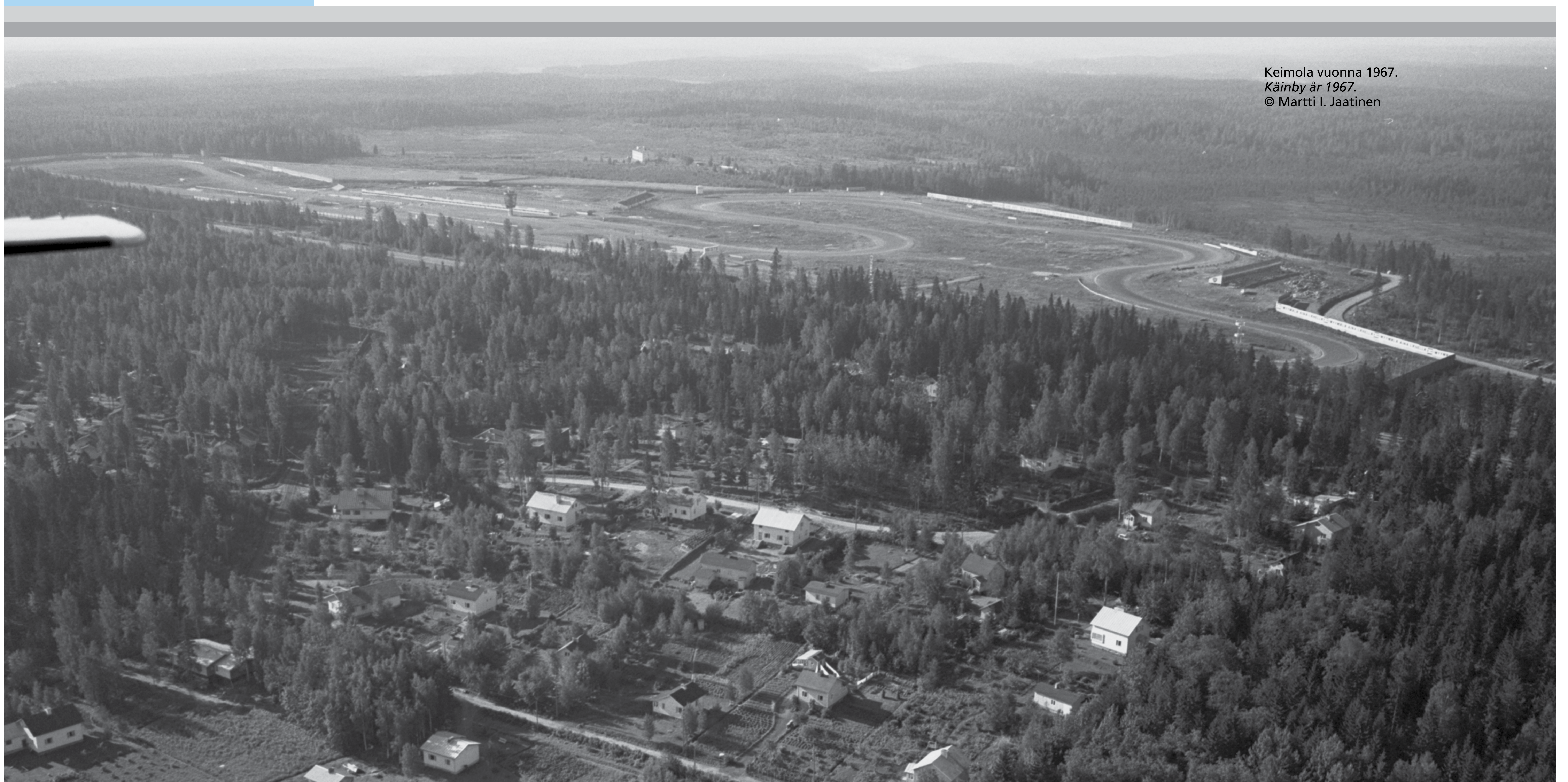
Keimola vuonna 1967. Käinby år 1967. © Martti I. Jaatinen