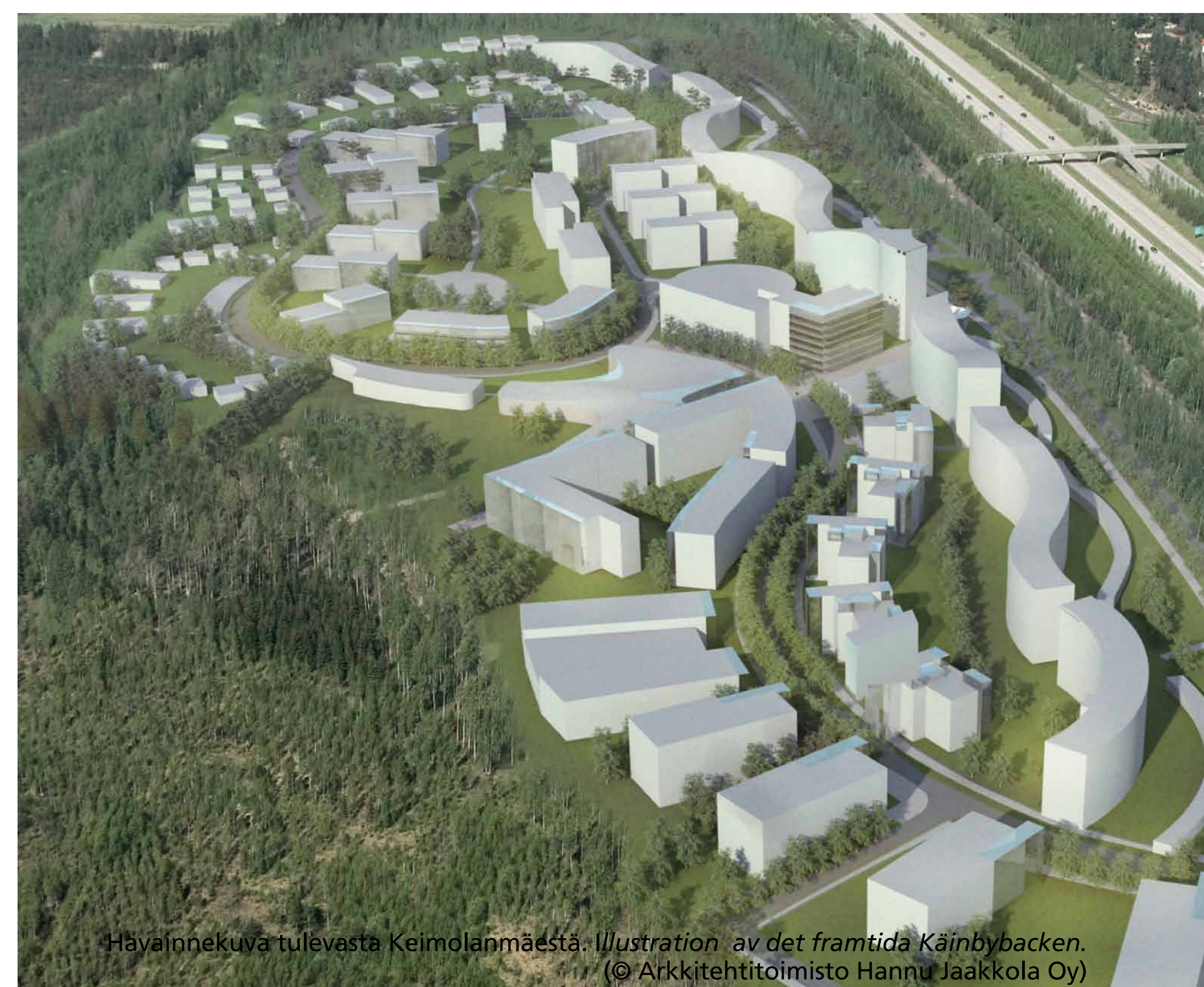
Hävinnökurva tulevasta Keimolanmäestä. Illustration av det framtida Käinbybacken. © Arkkitehtitoimisto Hanna Jaakkola Oy

Där motorstadion i Käinby fanns har nu det nya bostadsområdet Käinbybacken planerats. Racerbanan har utgjort motiv för de nya namnen på området. En del av banan finns bevarad i Körlänken medan Lincolnplatsen berättar om banans grundare. Mälflaggsgården hänvisar till mållinjen och Bastulänken till en snäv kurva där det fanns en reklamskylt för korv. Fartgården hänvisar förutom till loppet i Käinby också till Fartvägen i Djurgården i Helsingfors.