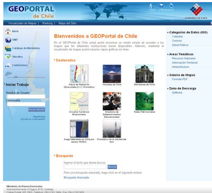
Figura N°3: Página de inicio del Geoportal de mapas, accesible a través de: www.snit.cl