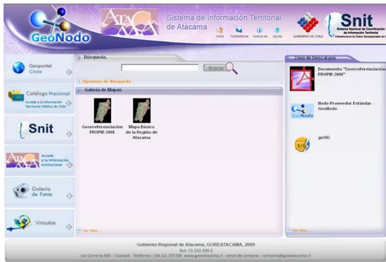
Figura N°4: Página de inicio del GeoNodo de la Región de Atacama.

Geonodo es el nombre de la herramienta y su construcción se ha realizado bajo plataforma de software opensource, con el objeto de que su distribución en las distintas instituciones del país, a partir del primer semestre del presente año, sea completamente libre del costo de licenciamiento.