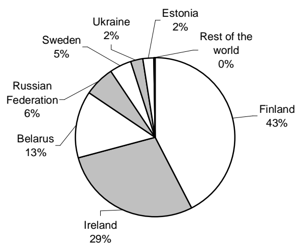
Figure 28: Major peat producing countries in 2010